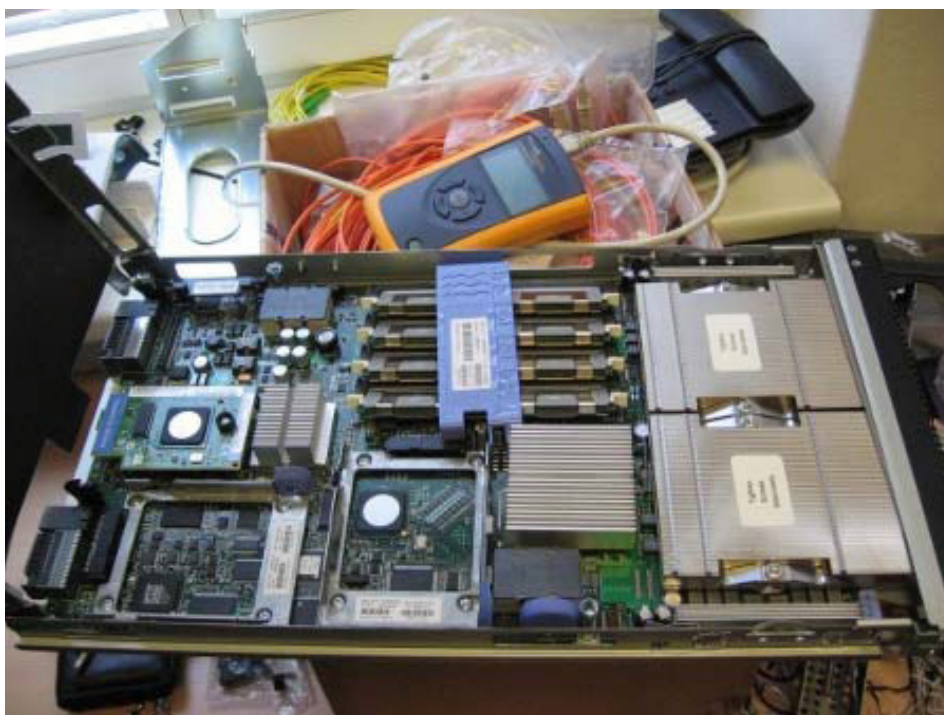
Obrázek 1 Jeden ze serverů (žiletka) systému IBM BladeCenter

Pro řešení tohoto konkrétního problému jsme se na Slezské univerzitě v Opavě rozhodli pro využití několika (momentálně 3) serverů, které vzájemně spolupracují v clusteru a v případě vyššího zatížení jsou mezi ně rovnoměrně rozdělovány požadavky na přístup k WWW serveru a databázi.